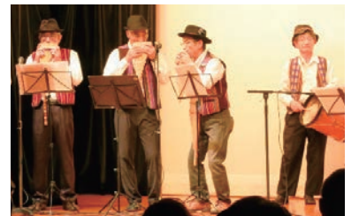
▲多くの方に見ていただける機会です!

☎042-575-3221 mail: fukushi_tsudoi@kunitachi-csw.tokyo