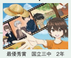
最優秀賞 国立三中 2年

体験期間 7月20日(土)～9月30日(月) 体験場所 市内・近隣の施設等 活動内容 お家でできるボランティア(カード作りなど)、高齢者施設、 保育園、ゴミ拾い、イベントのお手伝いなど自分で選べます。 オリエンテーション日時 7月12日(金) 午後6時～午後7時30分 7月20日(土) 午前9時30分～午前11時 7月22日(月) 午前10時～午前11時30分 オリエンテーション会場 くにたち福祉会館 参加対象 中学生以上 参加費 無料 ※ボランティア保険への加入が必要(350円～) 申込 7月5日より受付開始。電話・メールにて上記オリエンテーシ ョン日程より都合の良い日を選んで、お申し込みください。