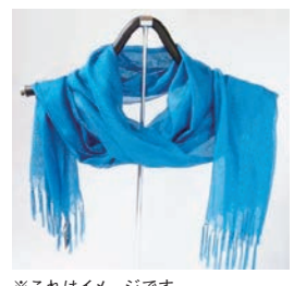
※これはイメージです。

対象 市内在住60歳以上 参加費 1,000円(材料・税込) 定員 20名 ※応募者多数の場合は抽選 申込 往復はがきに①氏名(ふりがな) ②住所③電話番号④年齢をご記入 のうえ左記まで。 〒186-8555 国立市富士見台2-38-5 国立市社会福祉協議会 総務企画係 「藍染ストールづくり」 締切 7月17日(水)必着